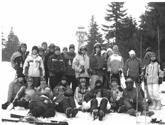
Lyžařský výcvikový kurz zima 2006