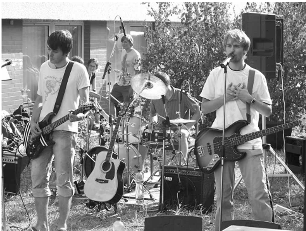
Jednou ze zájmových aktivit je i pravidelný festival rockové a folkové hudby - BIGYFEST