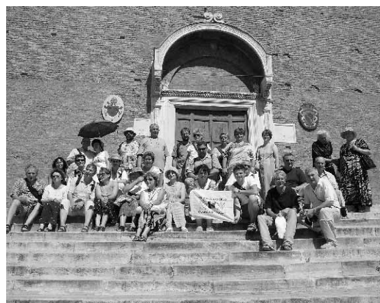
Poutní zájezd členů KD ČR do Říma, srpen 2006