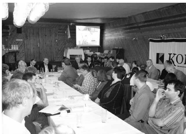
Setkání Kolpingových rodin na Vyhlídce, listopad 2006

ochotnické divadlo apod. Po dlouhém a nuceném přerušení činnosti v důsledku zákazu nacistickým a později komunistickým režimem, se činnost organizace (již pod novým názvem „Kolpingovo dílo“) znovu obnovuje. Občanské sdružení Kolpingovo dílo České republiky (KDČR) vzniká 21. října 1992 a hlásí se k odkazu Jednot katolických tovaryšů. KDČR je 13. února 1993 přijato do Mezinárodního Kolpingova díla. Sídlem centrálního svazu se stává Kolpingův dům ve Žďáře nad Sázavou. V současné době je registrováno přes 600 členů v 29 Kolpingových rodinách, které působí na území celé České republiky.