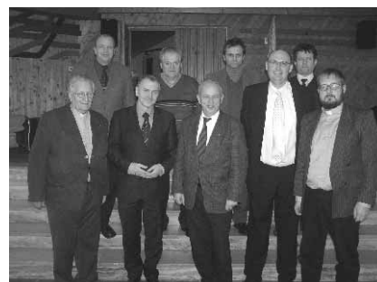
Foto z návštěvy generálního sekretáře Mezinárodního Kolpingova díla pana Huberta Tintelotta v ČR